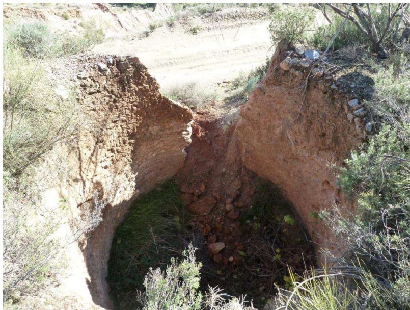
Vista de la calera