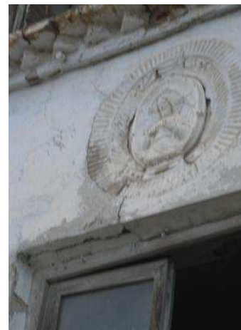
Detalles constructivos; puerta, balcón y escudo de armas