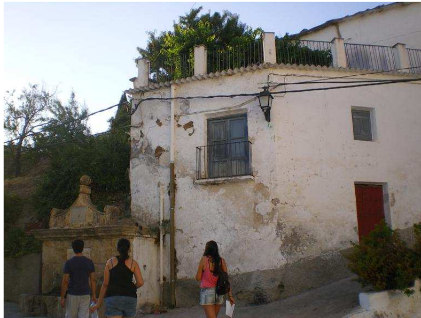
Vista principal de la casa