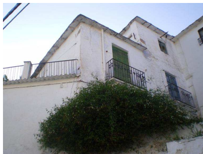
Vista posterior de la casa