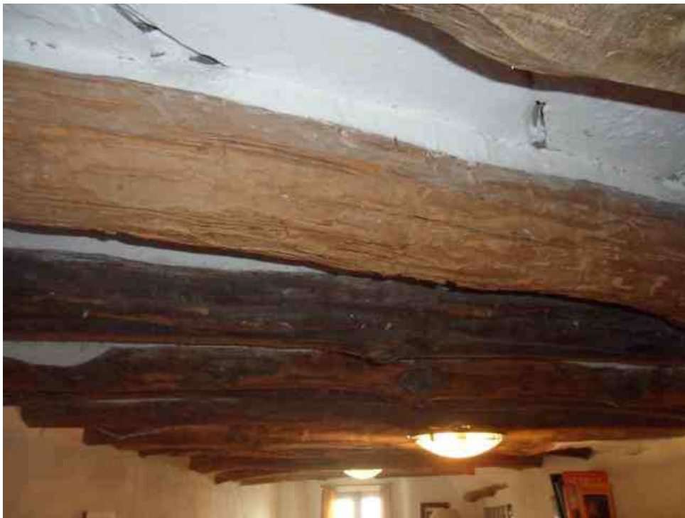
Uso del castaño y del álamo en los sistemas de soporte y estructura constructiva.