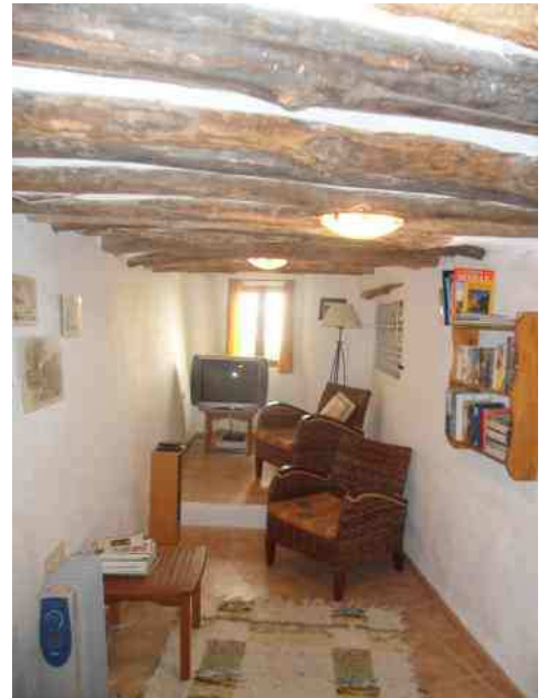
Espacios para huéspedes