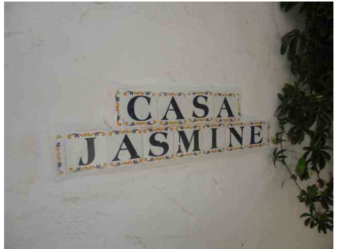
Entrada a la casa en el Barrio de Santa Lucía, Nechite.