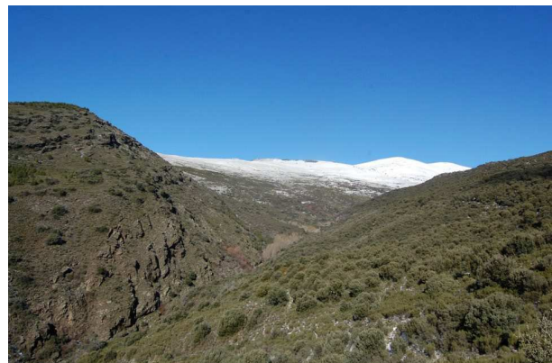
Pico Morrón de San Juan