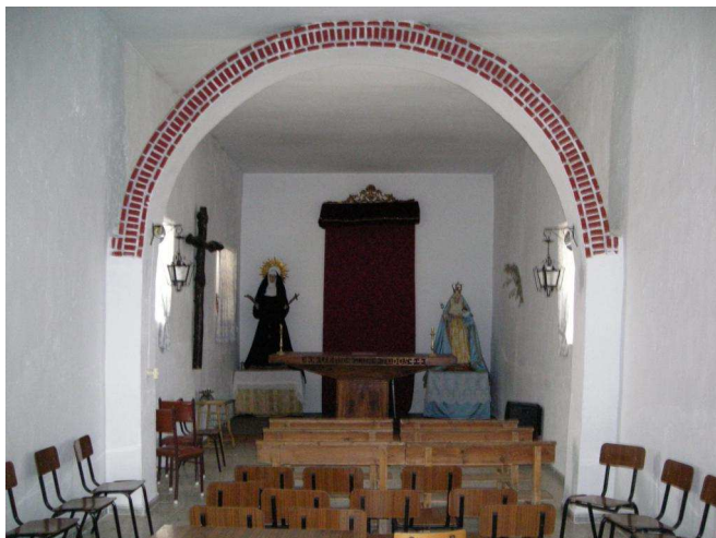
Vista del interior de la ermita