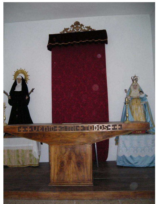
Figuras de la ermita