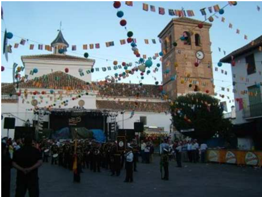
Procesión por las calles del pueblo