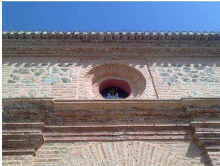
Vista superior de la fachada