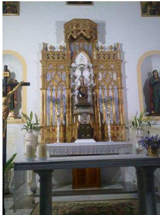
Figuras de la Iglesia