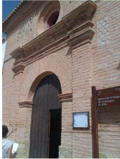
Fachada de la Iglesia