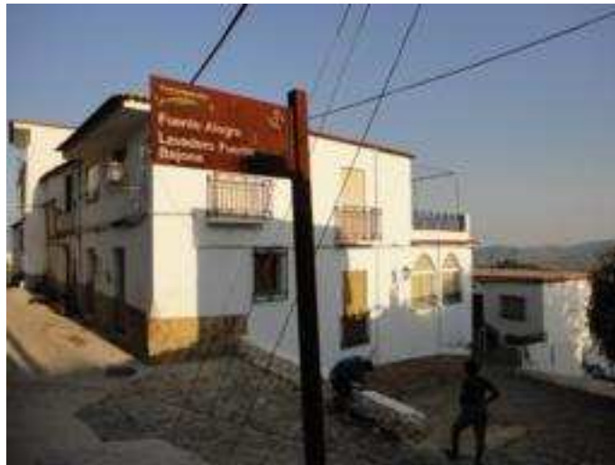
Vista principal del lavadero