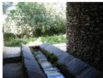
Detalles del lavadero