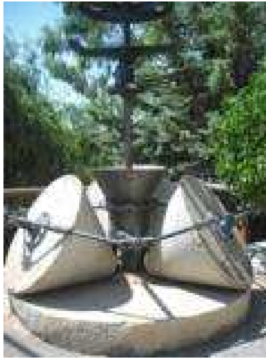
Piedras del molino