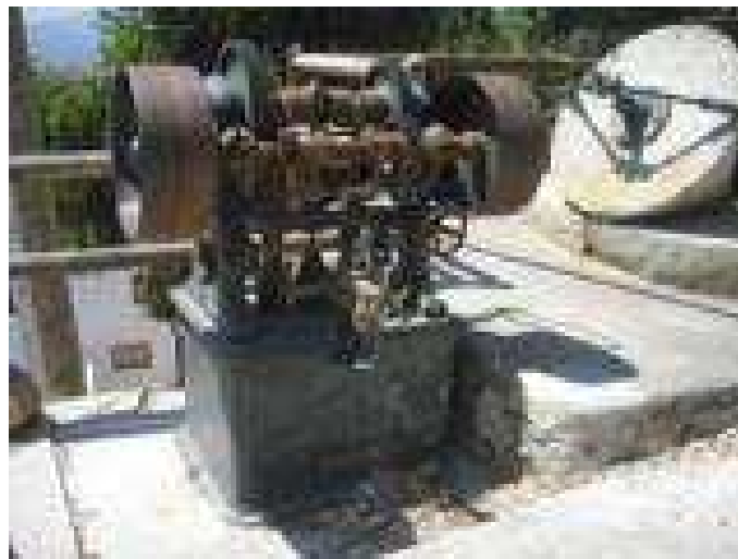
Maquinaria de la almazara