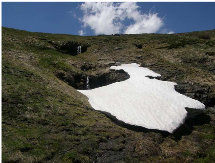
Manantial de las Primeras Aguas