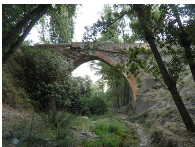
Vista general del puente