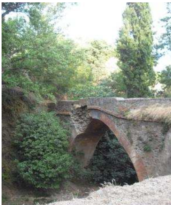
Vista principal del puente