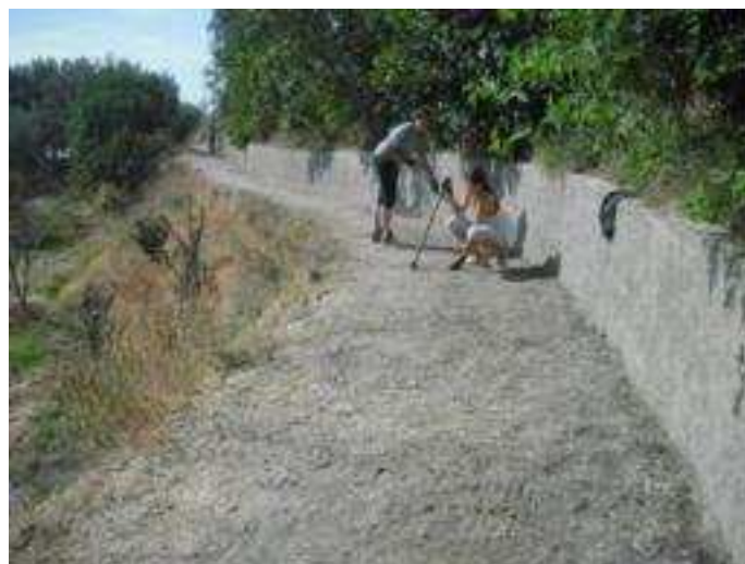
Detalles del camino