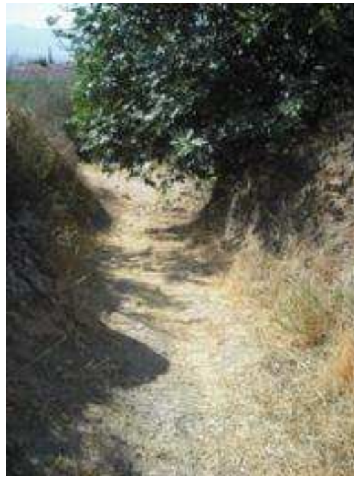
Vista principal del sendero