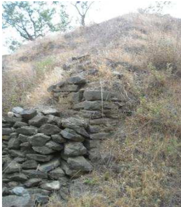
Vista del muro