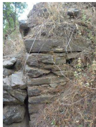
Detalles de la construcción