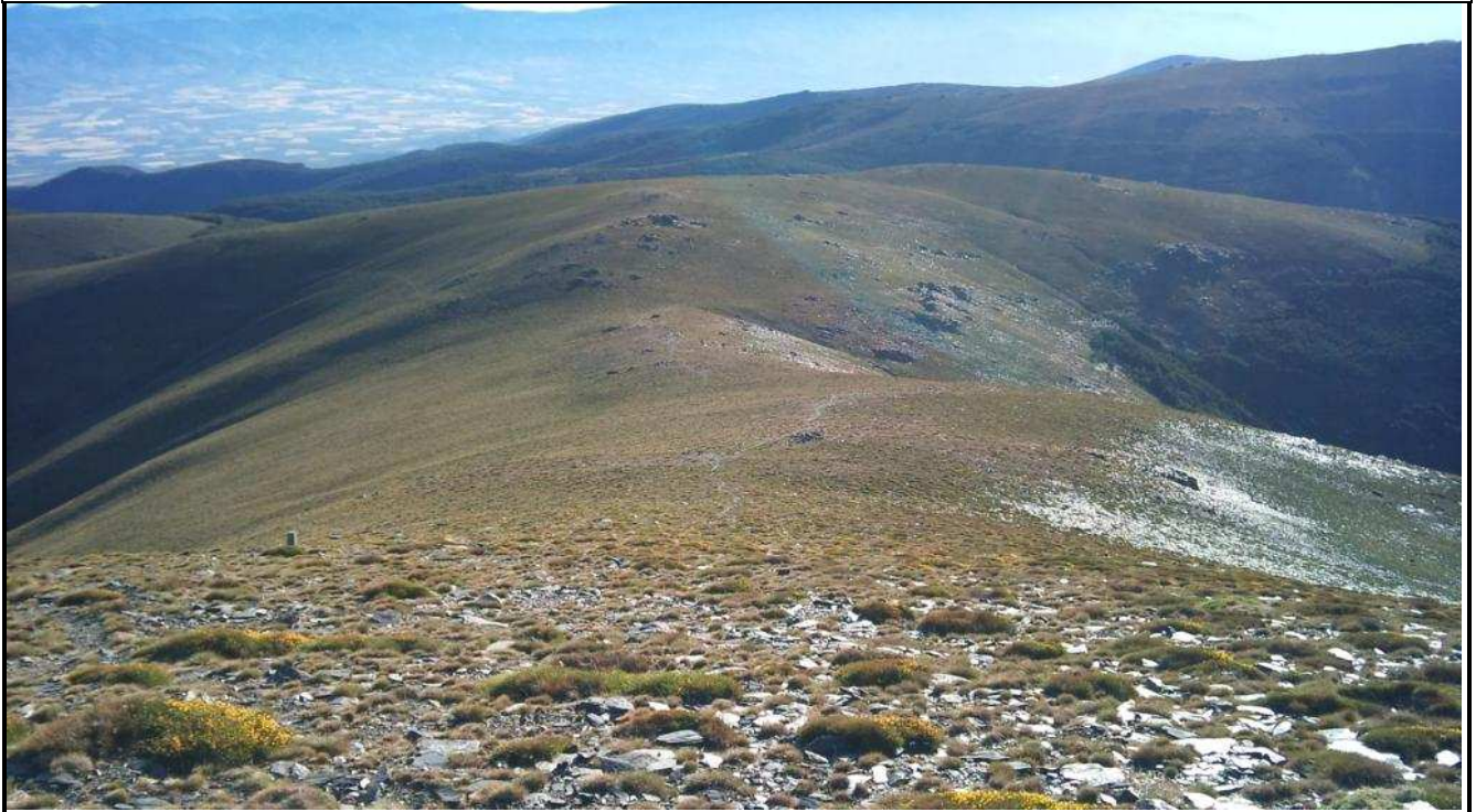
Vista del Collado del Lobo desde el Pico San Juan