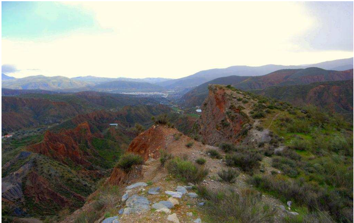
Vista Norte Sur desde el Cerro del Castillejo de los badlands que atraviesa la vereda, al fondo Ugíjar.