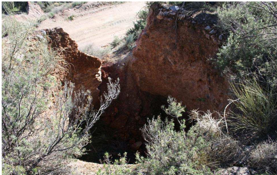
Ejemplo de yesera en la comarca