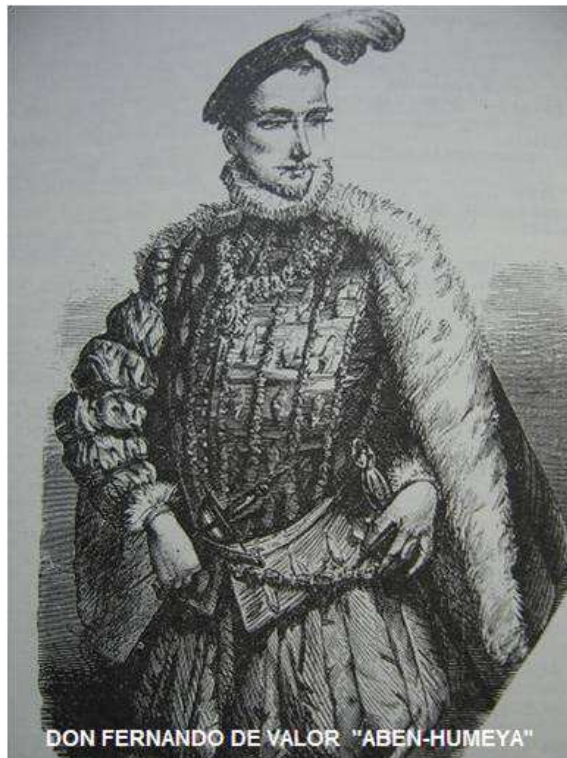
Don Fernando de Válor, Abén Humeya