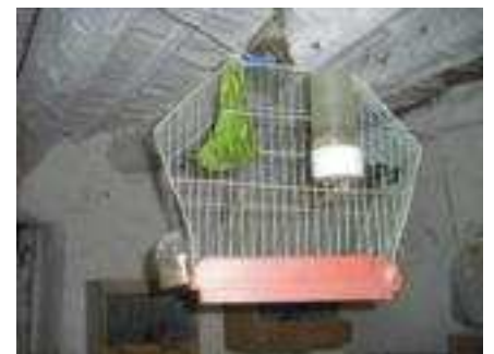
Detalles del cortijo