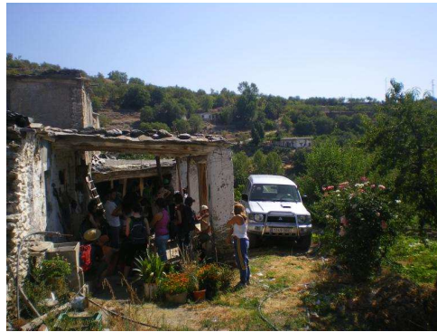
Destalles del cortijo