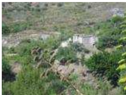
Vista panorámica del cortijo