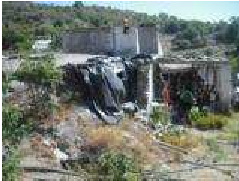
Vista principal del cortijo