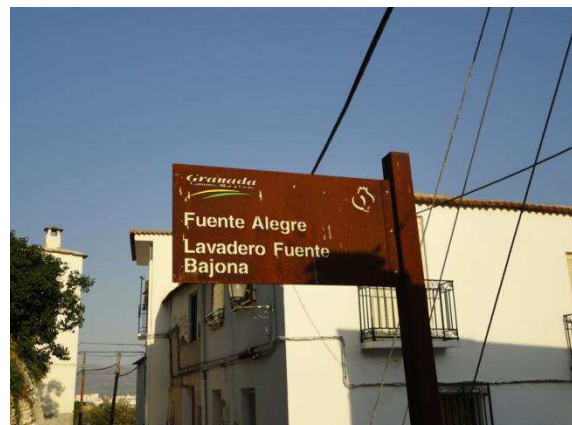
Emplazamiento de la fuente y cartel de señalización