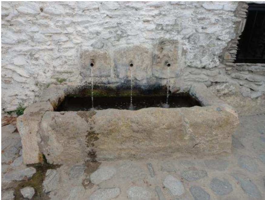
Fuente con tres caños en piedra de cantería