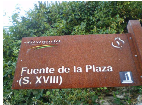
Detalles de la placa de inscripción y cartel de señalización