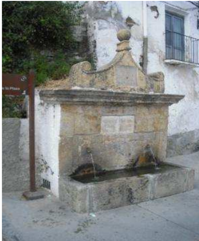
Fuente en piedra de cantera de aspecto neoclásica