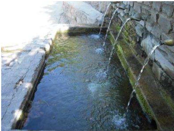
Diferentes caños de agua