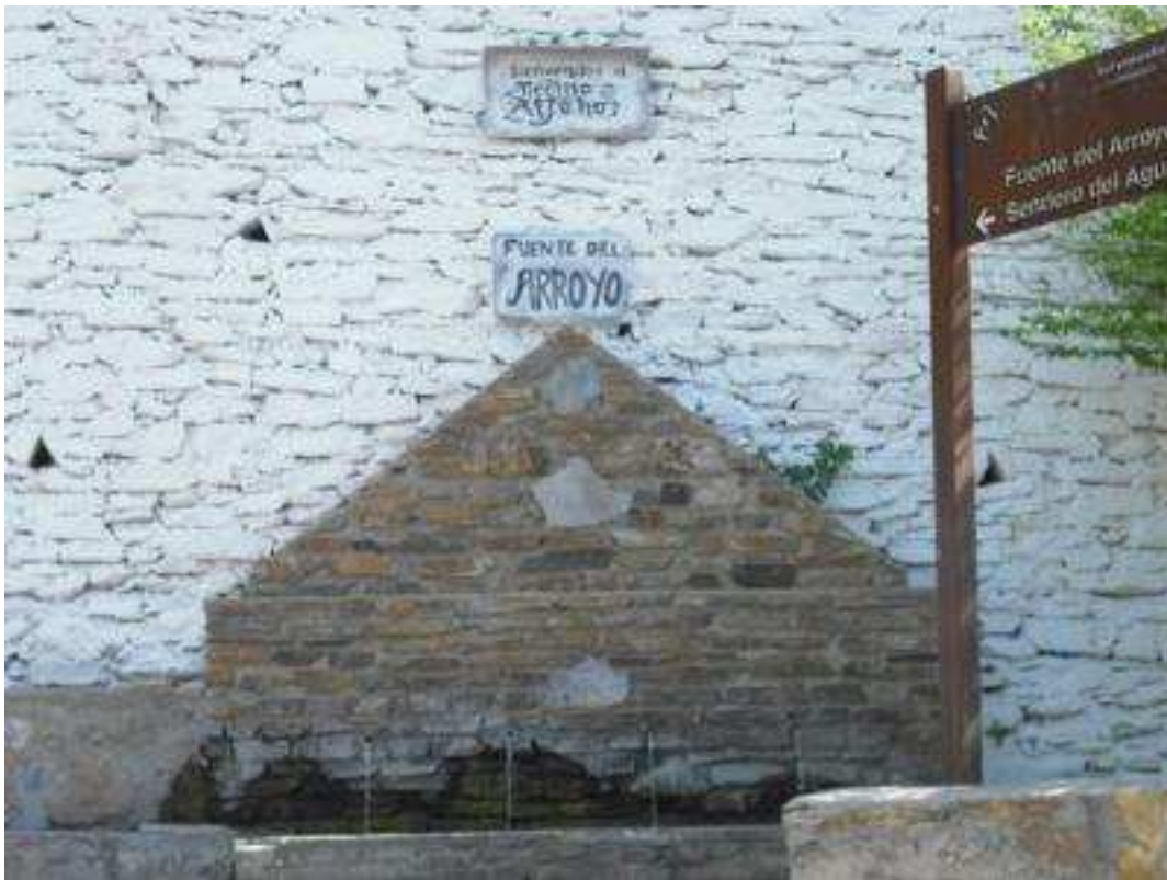
Vista principal de la fuente