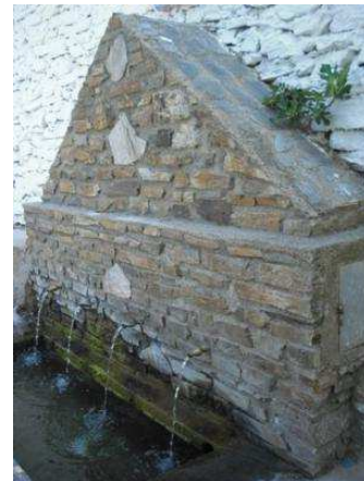
Vista de la fuente