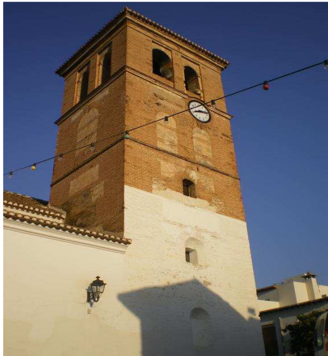
Vista de la torre de la Iglesia ubicada en la plaza