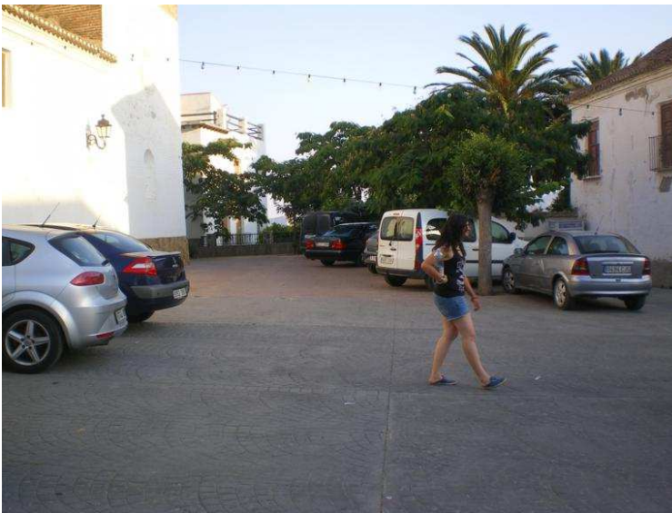
Vista de la plaza