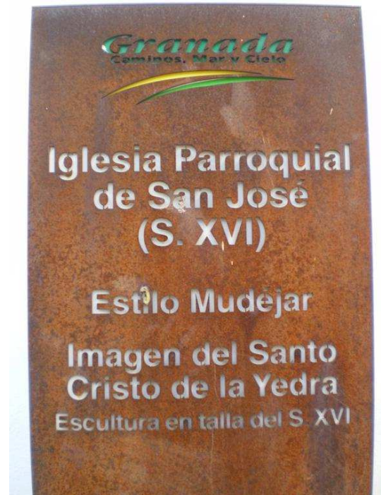
Cartel informativo de la iglesia