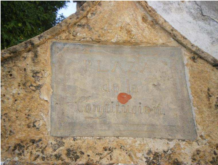
Cartel de la fuente de la plaza